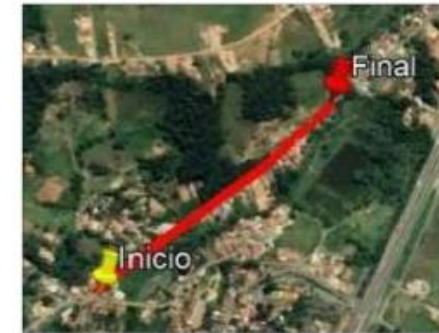
PLANTA DE LOCALIZAÇÃO S/ ESCALA