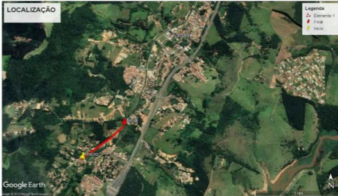
PLANTA DE LOCALIZAÇÃO S/ ESCALA