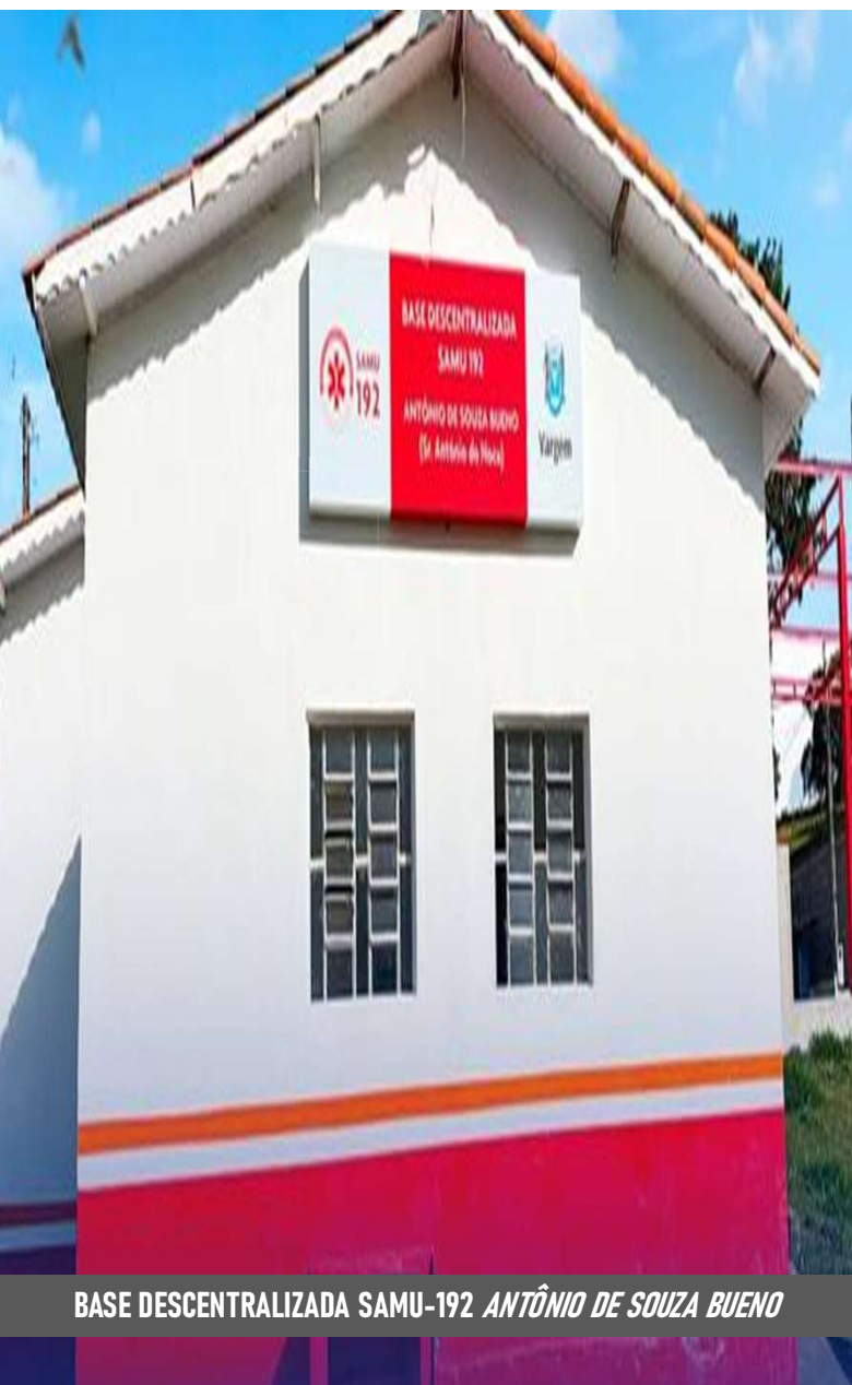
BASE DESCENTRALIZADA SAMU-192 ANTÔNIO DE SOUZA BUENO