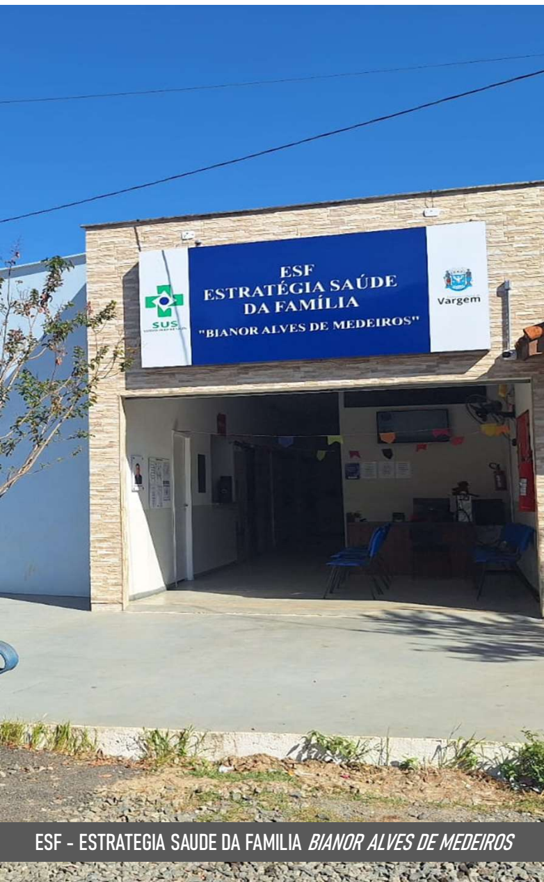
ESF - ESTRATEGIA SAUDE DA FAMILIA BIANOR ALVES DE MEDEIROS